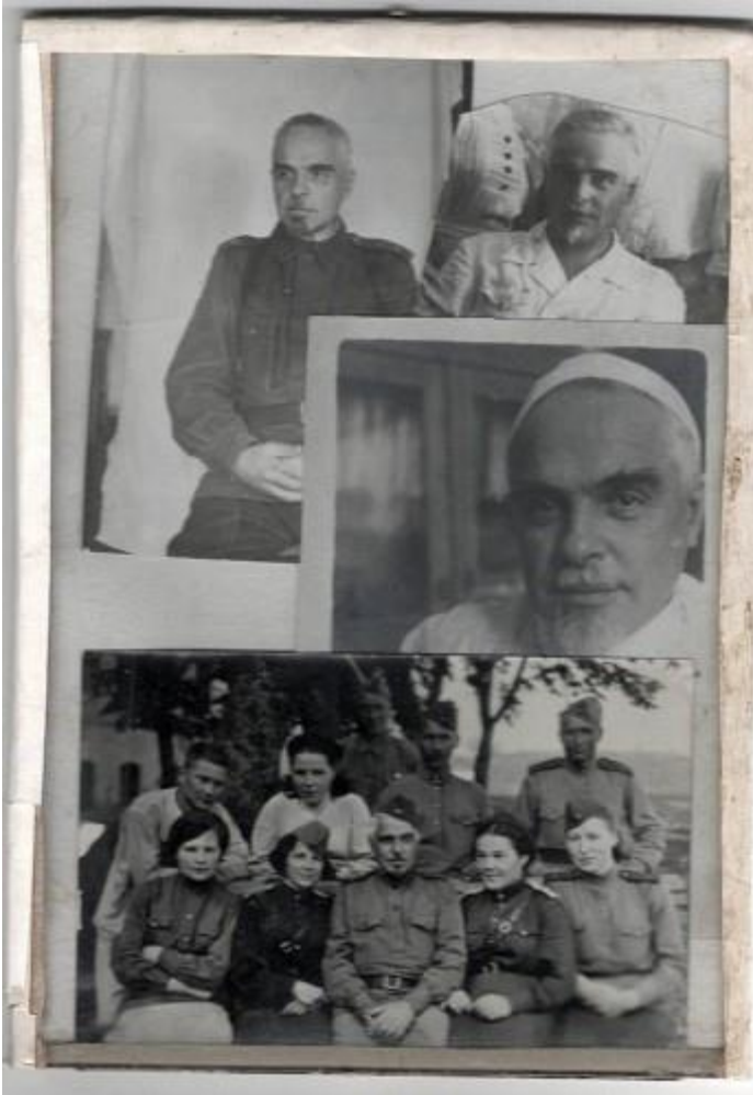
Несколько снимков в одной «рамке» — вверху — на фронте (43 или 44 г.), справа вверху — 30-ые годы, внизу — группа мед усиления на фронте и справа внизу — в клинике после войны.

Д.А. с войсками вошел в Германию, кажется, был в Вене (но тут я, может быть, вру). Где-то в Германии он был на постое в доме учителя, попросил из любопытства дать ему почитать «Mein Kampf». Учитель сказал, что у него нет, но принес экземпляр с готическим шрифтом, папа попросил с латинским. С учителем разговорились, папа рассказал о семье, сказал, что он профессор, приврал, что у него дом и, перечисляя комнаты, забыл назвать столовую. Его переспросили. «В Азии тепло, едим на веранде», вывернулся он (вот вам «гордость советского человека»). Из Германии он посылку не посылал, привез с собой приемник (хотя наш, арестованный, после войны вернули), несколько подарков: какую-то вазочку, 3 шкурки рыжих лис, еще что-то и по платью маме и мне. Эти платья оказались у него так: немцы, у которых он стоял на постое, куда-то переезжали, взяли все вещи, но оставили два платья. Папа решил, что это – подарок для нас.