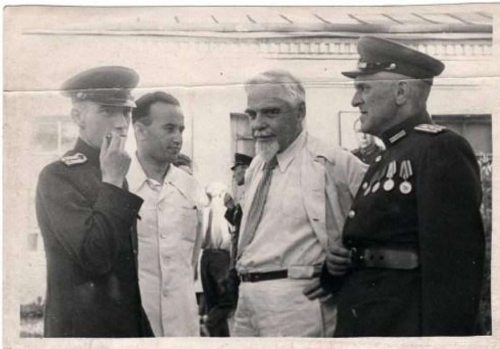
После войны в военном госпитале в Ташкенте.